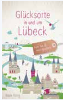
Glücksorte in und um Lübeck von Beate König. Droste-Verlag, 168 Seiten, 14,99 Euro.

In dieser Ausgabe der NORDSPITZE stellen wir drei Neuerscheinungen von Autor*innen aus Bremen, Hamburg und Kiel vor.