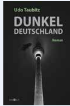
Dunkeldeutschland von Udo Taubitz. Books on Demand, gebundenes Buch, 255 Seiten, 20 Euro.

4 „Fahr hin & werd glücklich“ wirbt die Buchreihe (mit inzwischen mehr als 100 Bänden für diverse Städte und Regionen innerhalb und außerhalb Deutschlands) im Untertitel – wer ließe sich davon nicht gerne locken? Doch im Ernst: Lübeck (und Umgebung) ist auch ohne jede Verlagsprosa eine Reise wert – sogar dann, wenn manche Orte wegen der Pandemie nur eingeschränkt zugänglich sind. (sas)