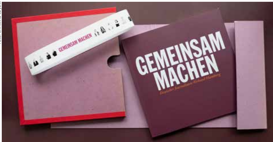
Schuber aus dem NDR-Bandarchiv, die durch die Digitalisierung ausgedient hatten, dienten als Verpackung

Schon wenige Tage nach Kriegsende fanden sich in Hamburg aufrechte Journalisten zusammen, die während des NS-Regimes ihren Beruf nicht ausüben konnten oder wollten. In wenigen Monaten gründeten sie einen Verband politisch unbelasteter Berichtersteller – die Berufsvereinigung Hamburger Journalisten (BHJ), Vorläufer des DJV Hamburg.