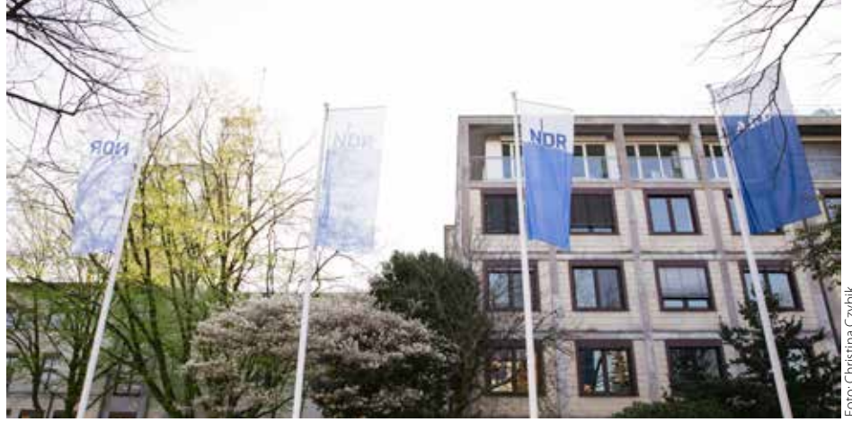
Nicht nur bei den Freien sorgen die NDR-Pläne für erheblichen Unmut