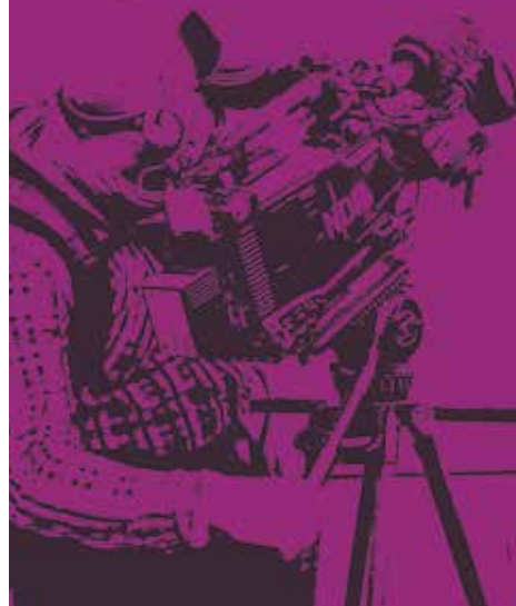
Illustration: Christina Czybik