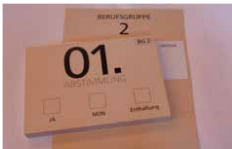
Mitgliederversammlung der VG Wort in München: Auch die Berufsgruppe 2 stimmte für den neuen Verteilungsplan