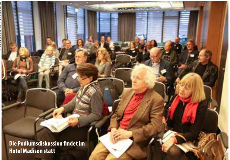
Die Podiumsdiskussion findet im Hotel Madison statt