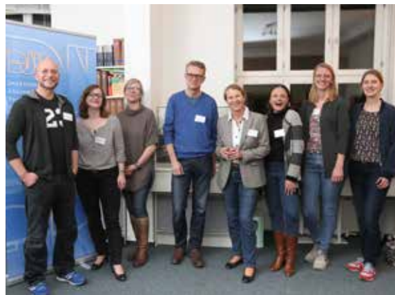
Willkommen im DJV! Wir hoffen, das war nur der erste von vielen Besuchen bei unseren Veranstaltungen