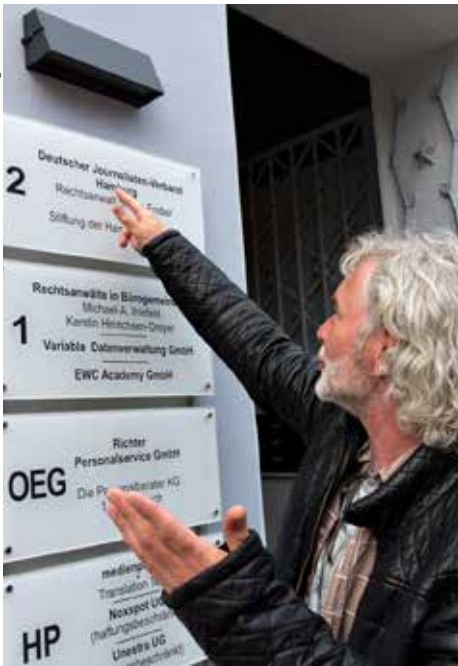
Dänische Kollegen zu Besuch im Hamburger Stellahaus