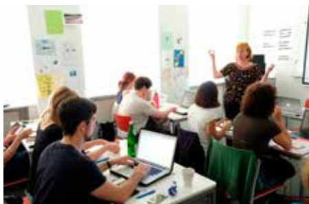
Profilagentin Kixka Nebraska hatte im Vorwege ihres Workshops die Internetpräsenzen der Teilnehmenden durchgesehen und konnte ihnen dadurch gezielt Tipps zur Optimierung geben