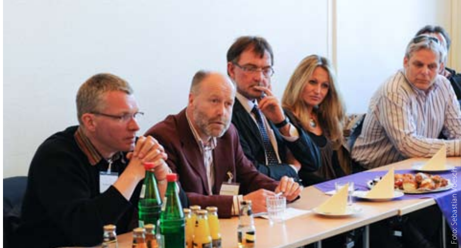
Journalisten setzten sich mit Pressevertretern der Polizei an einen Tisch

Annäherung von Polizei und Presse in Schleswig-Holstein