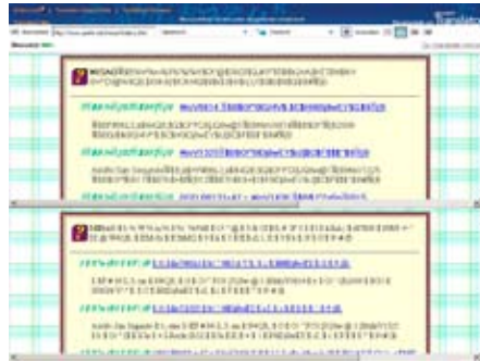
Bei exotischen Sprache, hier Japanisch, versagt Bing häufiger.

während Bing da häufiger patzt und gar nicht übersetzt, selbst wenn die automatische Spracherkennung ausgeschaltet und die Fremdsprache explizit angegeben wird. Das, was bei einer Übersetzung ins Deutsche herauskommt, kommt natürlich auch in der anderen Richtung heraus und ist in keiner Weise druckreif. Wenn es sich absolut nicht vermeiden lässt gilt: je einfacher und kürzer die