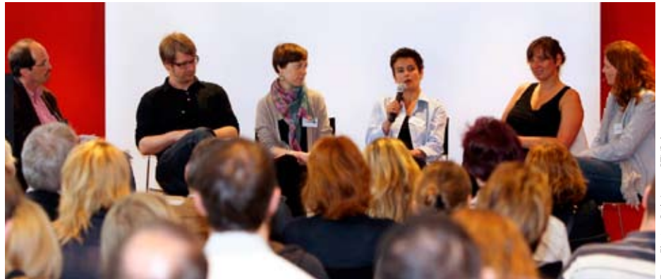
Auf dem Netzwerktag diskutierten Freiberufler über aktuelle Branchentrends und persönliche Erfolgsrezepte

18. Juni 2010 n. Ch. Ganz Deutschland schaut die WM-Partie Deutschland gegen Serbien...ganz Deutschland? Nein! 70 unbeugsame Kolleginnen und Kollegen finden sich in den Räumlichkeiten des Instituto Cervantes im Chilehaus ein, um beim 3. Netzwerktag für Freie dabei zu sein.