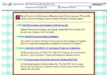
Google-Übersetzung aus dem Japanischen - mit etwas Fantasie einigermaßen zu verstehen.

während Bing da häufiger patzt und gar nicht übersetzt, selbst wenn die automatische Spracherkennung ausgeschaltet und die Fremdsprache explizit angegeben wird. Das, was bei einer Übersetzung ins Deutsche herauskommt, kommt natürlich auch in der anderen Richtung heraus und ist in keiner Weise druckreif. Wenn es sich absolut nicht vermeiden lässt gilt: je einfacher und kürzer die