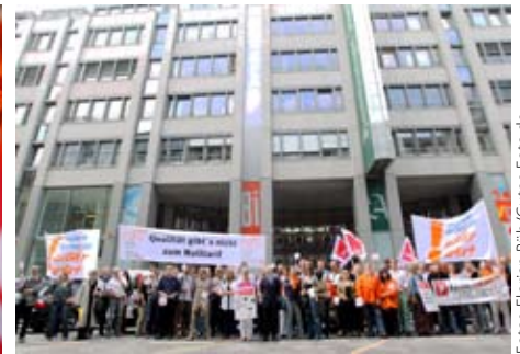
Mit zahlreichen Aktionen im Norden verhinderten Journalisten massive Einschnitte bei den Tarifen – beispielsweise Kürzungen der Gehälter für Berufseinsteiger bis zu 30 Prozent

setzung um ein paar Gehaltsprozente. Diesmal ging es um die Frage, welchen Stellenwert Qualitätsjournalismus zukünftig haben soll. Die Verleger wollten eine Abwertung: Massive Verschlechterung der Rahmenbedingungen und insbesondere des Gehaltes der Berufseinsteiger in einem Gesamtvolumen bis zu 30 Prozent (Einzelheiten finden Sie unter: http://www.djv.de/Tarifpolitik-aktuell-Verlege.3143.0.html ).