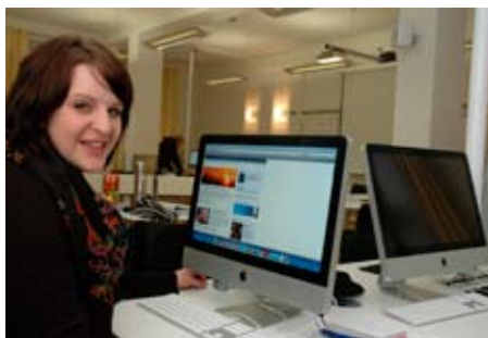
Die Zahl motivierter Nachwuchs-Journalisten im Norden ebbt trotz schlechter Startbedingungen nicht ab