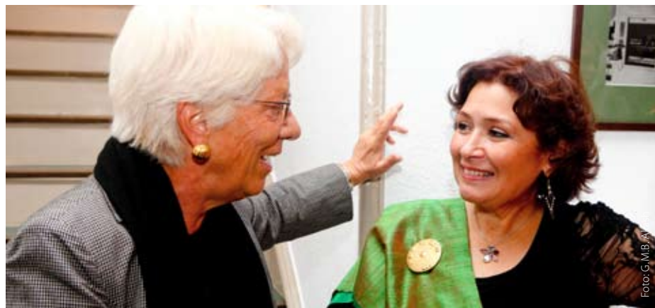
Zwei Streiterinnen für die Menschenrechte: Die ehemalige Chefanklägerin Carla del Ponte und die Journalistin Sihem Bensedrine (rechts) beim Stiftungs-Jubiläum im Warburg-Haus