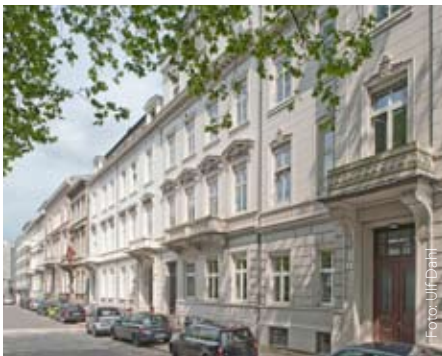
5000 Euro für Weiterbildung an der Akademie für Publizistik

Unter dem Motto „Die halbe Miete“ haben die Akademie für Publizistik und die Stiftung der Hamburger Presse ein Projekt zur Förderung der Weiterbildung gestartet. Freie Journalisten mit Wohnsitz in Hamburg erhalten die halbe Seminargebühr bis maximal 250 Euro geschenkt. Zur Wahl stehen ab Januar 2012 sämtliche Seminare der Akademie für Publizistik - ausgenommen sind Kurse zu PR und Öffentlichkeitsarbeit. Insgesamt stellt die Stiftung 5000 Euro für Journalisten bereit. Spätestens sechs Wochen vor Seminarbeginn müssen Freie sich mit Lebenslauf und einer Arbeitsprobe schriftlich