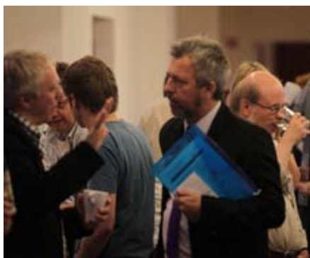
Neben den Podien und Workshops gab es am Rande des Netzwerktags reichlich Gelegenheit, Kollegen zu treffen.