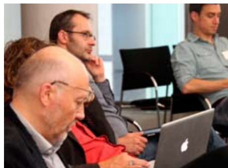
Während der Fachtagung im Bonner Post Tower wurde getwittert, gefilmt, fotografiert und diskutiert...