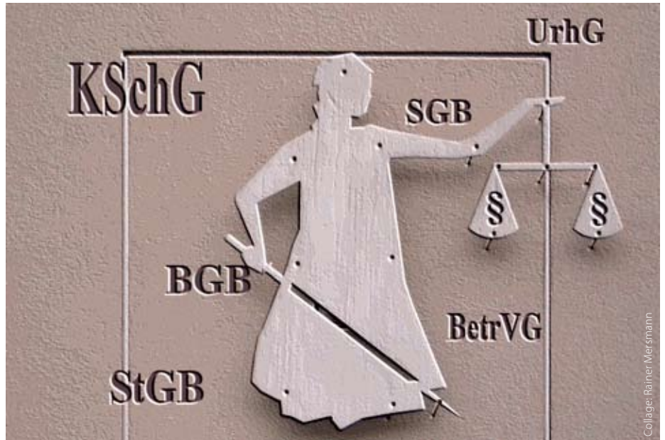
DJV steht Journalisten bei allerlei rechtlichen Fragen zur Seite

Was umfasst der Rechtsschutz? Der DJV-Rechtsschutz beinhaltet sowohl die Beratung als auch die außergerichtliche sowie die gerichtliche Vertretung. Der DJV entscheidet, ob er die Sachen selbst übernimmt oder Anwaltskanzleien beauftragt. Worauf ist zu achten? Der Rechtsschutz ist grundsätzlich schriftlich zu beantragen (Formulare gibt es in den Geschäftsstellen oder unter www.djv-hamburg.de ).