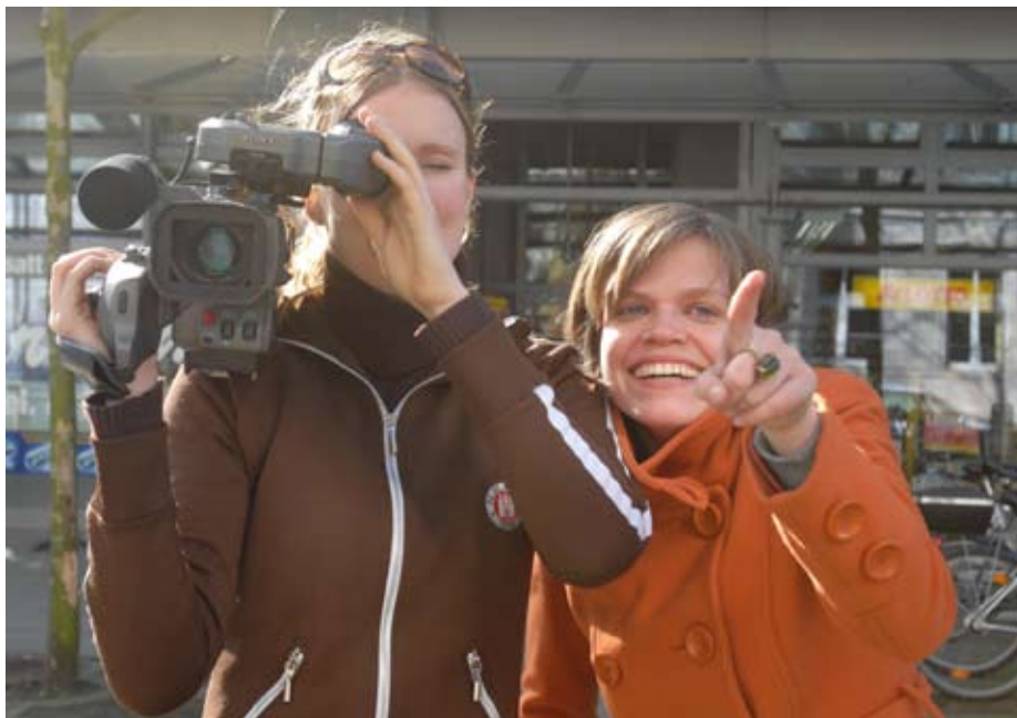
Crossmediale Inhalte sind zum festen Bestandteil journalistischer Ausbildungsprogramme geworden

So hat der Schleswig-Holsteinische Zeitungsverlag (shz) in Flensburg, zu dem unter anderem das Flensburger Tageblatt und die Schweriner Volkszeitung gehören, vor einem Jahr sein Volontariat an den Masterstudiengang „Journalismus und Medienwirtschaft“ der Fachhochschule Kiel gekoppelt. Die Volontäre müssen nun neben der Arbeit in den Redaktionen