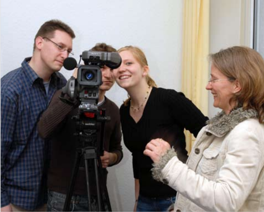
In der Multimedialität und ihrer Verankerung in der Volontariatsausbildung sehen Experten die Zukunft des Journalismus