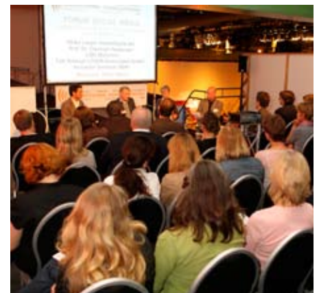
Die Foren waren bis auf den letzten Platz besetzt – wie hier das Forum zum Trendthema Social Media