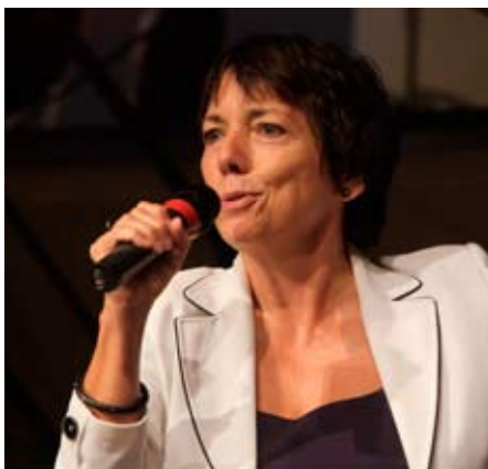
In ihrem Impulsreferat ermutigte Margot Käßmann die Kolleginnen und Kollegen zu mehr Entschleunigung