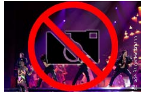
dpa hat dieses Mal kein Foto von Take That

Mit einer Achtungsnotiz informierte die Nachrichtenagentur dpa ihre Kunden drei Tage im Voraus darüber, dass sie vom ersten Deutschland-Konzert der wiedervereinigten Boyband Take That in Hamburg weder Fotos noch Textberichterstattung erhalten würden. Da das Management keine Fotografen von Presseagenturen zu dem Konzert am 22. Juli in der Imtech-Arena zulasse, verzichte die Deutsche Presse-Agentur komplett auf eine Berichterstattung. Nach Auskunft von dpa-Pressesprecher Christian Röwekamp gab es im bundesweiten Basisdienst in den vergangenen zwölf Monaten ein halbes Dutzend solcher Verzichtsfälle bei Konzerten. Von den Redaktionen erhalte man zwar vereinzelt Nachfragen, spüre aber insgesamt „eine sehr große Solidarität“. Veranstalter versuchen immer wieder, Bildjournalisten bei ihrer Arbeit in unzumutbarem Ausmaß einzuschränken. sas