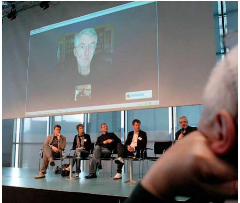
270 Journalisten diskutierten in 17 Veranstaltungen: Themen der Fachtagung waren der Schnelllebenswahn im Online-Journalismus, die Möglichkeiten, im Netz Geld zu verdienen, Wikileaks sowie natürlich soziale Netzwerke