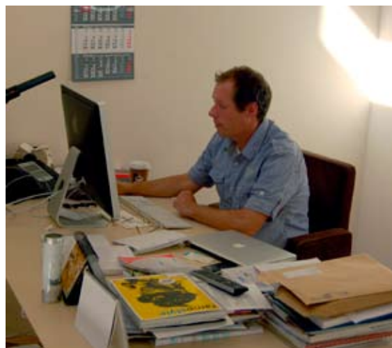
Mit Geschichten, die polarisieren, eroberte der ehemalige Print-Mann die Marktführerschaft

Das stimmt, während der letzten drei Jahre habe ich wahnsinnig viel gearbeitet. Gut, dass ich vorher nicht gewusst habe, was da alles auf mich zukommt.