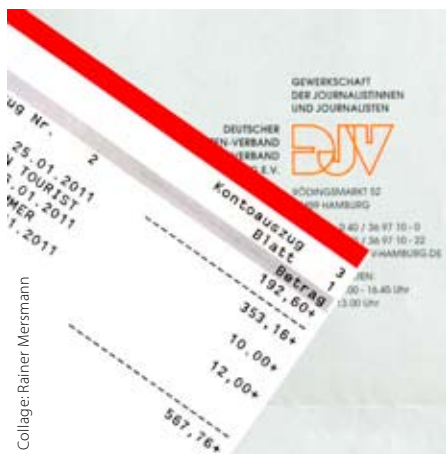
Collage: Rainer Mersmann

Erfolgreicher Einsatz für einen freien Kollegen: Das Justitiariat des Deutschen Journalisten-Verbandes (DJV) Hamburg hat für ein freiberuflich tätiges Mitglied im Rahmen einer außergerichtlichen Rechtsvertretung Zahlungen in Höhe von ca. 13.500 Euro durchsetzen können. Der Fall: Das Mitglied hatte journalistische Leistungen für einen Auftraggeber erbracht. Grundlage war ein entsprechender, zwischen den Parteien geschlossener Vertrag. Verabredungsgemäß hatte der Journalist Teilrechnungen gestellt, die jeweils nicht bezahlt wurden. Das Mitglied bat den DJV um Hilfe, der die Beträge jeweils unter Fristsetzung anmahnte.