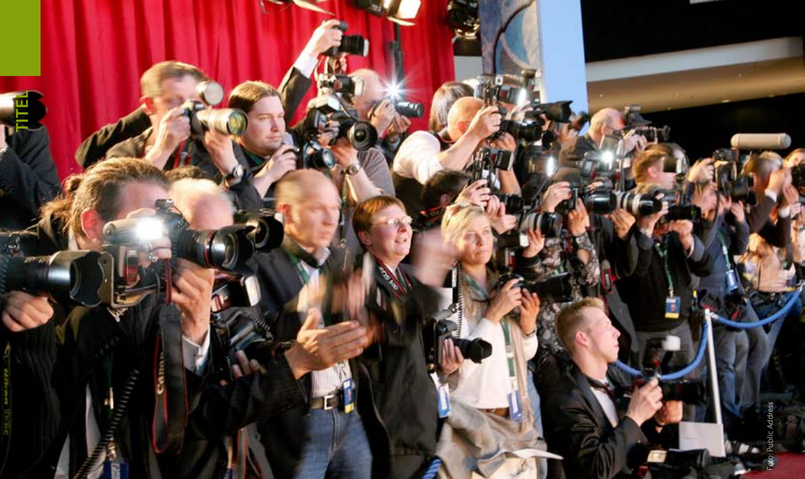
Fotografen werden heute in ihrer Bewegungsfreiheit immer stärker eingeschränkt

Es war einmal... Die Freiheit der Fotografen