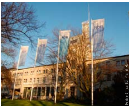
Im Mai wählt der NDR neue Personalräte

Am 18. und 19. Mai. ist es wieder so weit. Die Personalvertretungen im NDR werden neu gewählt und zwar für die norddeutschen Bundesländer Mecklenburg-Vorpommern, Schleswig-Holstein, Niedersachsen und Hamburg. In den Staatsvertragsländern haben sich bei Vorabstimmungen alle Belegschaften für örtliche Personalräte in Rostock, Schwerin, Kiel, Oldenburg, Hannover und Hamburg ausgesprochen. Das heißt, es wird künftig wieder einen Gesamtpersonalrat geben, der sich um die Belange der Landesfunkhäuser und der Studios kümmert.