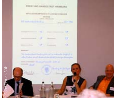
Im vorigen Jahr gab es gute Noten für den DJV Hamburg