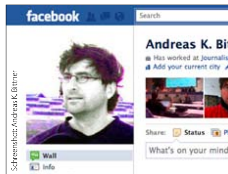
Bittner führt Listen mit abgestuften Rechten

„Die machen ein großes Geheimnis darum, was mit den Daten passiert, die auf Facebook gesammelt werden“, sagt