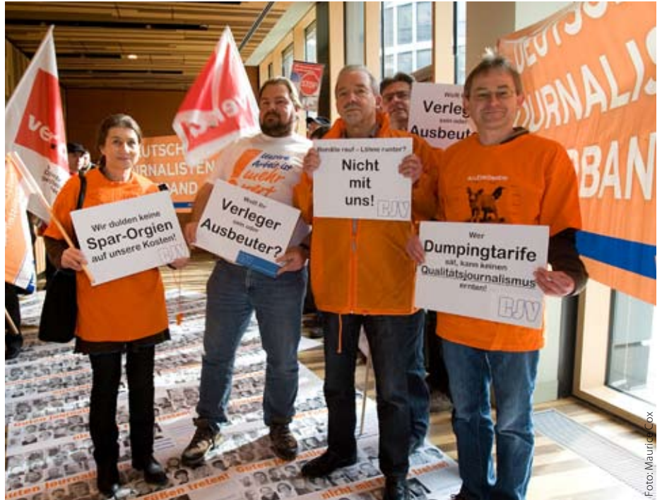
Vor der Verhandlungsrunde im Kölner Hotel Radisson Blu protestierten Journalisten gegen Dumpingtarife

Der Tarifkonflikt spitzt sich zu. Ende Februar haben die Verleger die vierte Runde im Streit um Mantel- und Gehaltstarife abgebrochen. Offizieller Stein des Anstoßes war eine Protestaktion vor dem Verhandlungsraum. Die Reaktion zeigt den Ernst der Lage, schließlich ist eine Demonstration eine gängige demokratische Ausdrucksform. Zugleich nimmt die Empörung seitens der Journalisten zu.