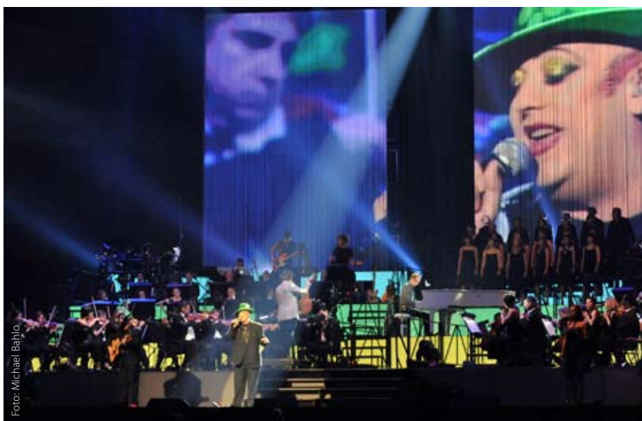
Bei Großkonzerten wie dem von Boy George üben Veranstalter zunehmend Kontrolle auf die Bilderproduktion aus