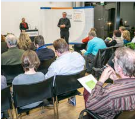
Vorstandswahlen vor zwei Jahren: Nun stehen in Kiel Neuwahlen an