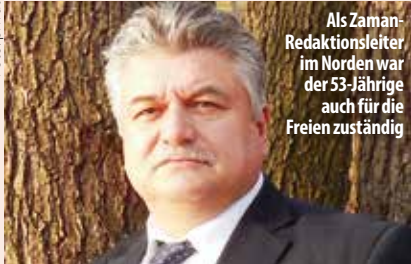
Als Zaman-Redaktionsleiter im Norden war der 53-Jährige auch für die Freien zuständig

Am 30. November 2016 erschien in Deutschland die letzte Druckausgabe von Zaman, der auflagenstärksten türkischen Zeitung, weil Abonnenten massiv bedroht worden sein sollen. Mit welchem Titelthema hat sich die Print-Redaktion von ihren Lesern verabschiedet?