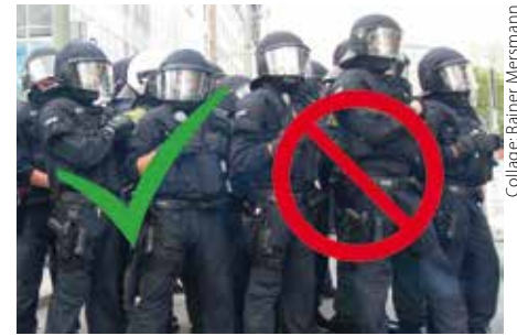
Collage: Rainer Meismann

Dürfen Polizei- und Spezialeinsatzkräfte bei Einsätzen fotografiert und gefilmt werden? Diese Frage wurde kürzlich für Bildjournalisten in Kiel aktuell. Der Kampfmittelräumdienst durchsuchte drei Schulen, die wegen einer akuten Bedrohung geräumt worden waren. An einer wurden die Medienvertreter aufgefordert, den Bürgersteig vor der Schule zu räumen und hinter eine „virtuelle“ Absperrung zu gehen, während Passanten diese ungehindert passieren durften. Der Kampfmittelräumdienst wolle (grundsätzlich) nicht bei seiner Arbeit gefilmt werden, hieß es. War diese Anordnung rechtmäßig? „Das Fotografieren und Filmen polizeilicher Einsätze unterliegt grundsätzlich keinen rechtlichen Schranken. Auch das Filmen und Fotografieren einzelner oder mehrerer Polizeibeamter ist bei aufsehenerregenden Einsätzen im Allgemeinen zulässig...“, heißt es in Ziffer 9 der „Verhaltensgrundsätze für Presse/Rundfunk und Polizei zur Vermeidung von Behinderungen bei der Durchführung polizeilicher Aufgaben und der Ausübung der freien Berichterstattung“ von 1993. Das Recht am eigenen Bild gilt zwar auch für Polizeibeamte, eine Einwilligung zur Verbreitung von Bildern eines Einsatzes ist jedoch nicht erforderlich, wenn die Aufnahmen bloß das Geschehen wiederge-