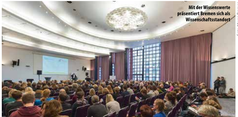
Mit der Wissenswerte präsentiert Bremen sich als Wissenschaftsstandort