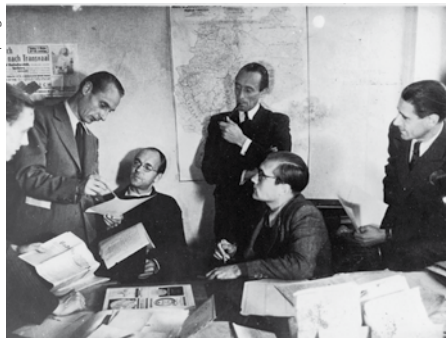
Foto aus dem Jahr 1947: Der Spiegel-Gründer Rudolf Augstein (2.v.r.) mit Redakteuren in Hannover

Ein glamouröses Denkmal? Ein unheimlicher Zombie? Oder sind es Schiffbrüchige, die ziellos im Gegenwind des aktuellen Meinungsklimas treiben? Es ist nicht einfach, dem Spiegel und seinen Verantwortlichen zum 70. Geburtstag eine die Bedeutung dieses Magazins treffende Gratulationsbotschaft zu senden: Zu was soll man sie beglückwünschen, außer dazu, dass es dieses Nachrichtenmagazin (noch immer) gibt?