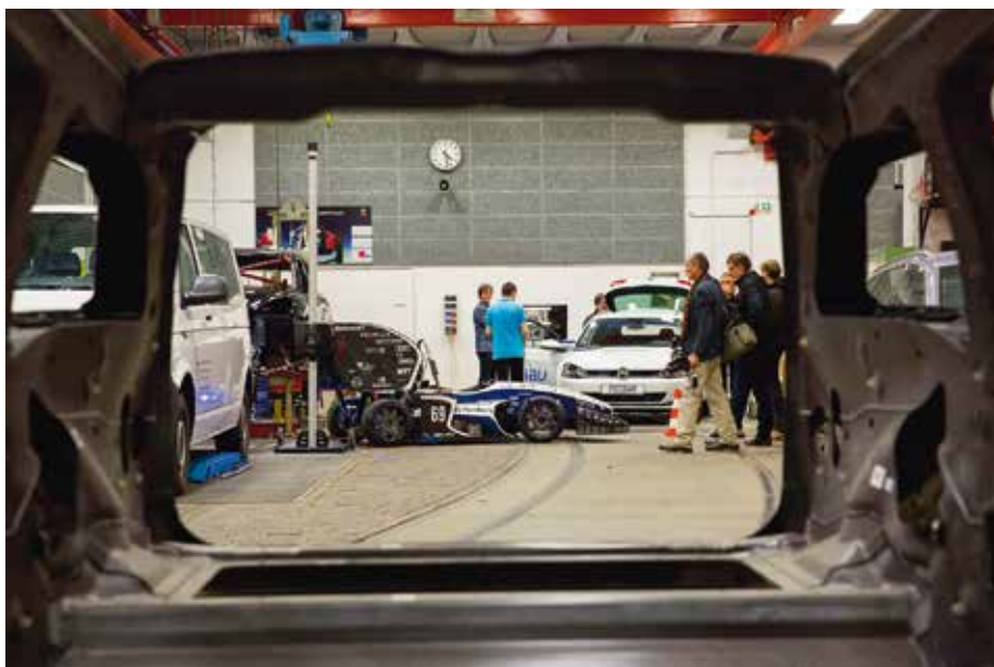
In der Fahrzeughalle des HAW-Departments Fahrzeugtechnik und Flugzeugbau befinden sich viele Prüfstände für ein angewandtes Studium