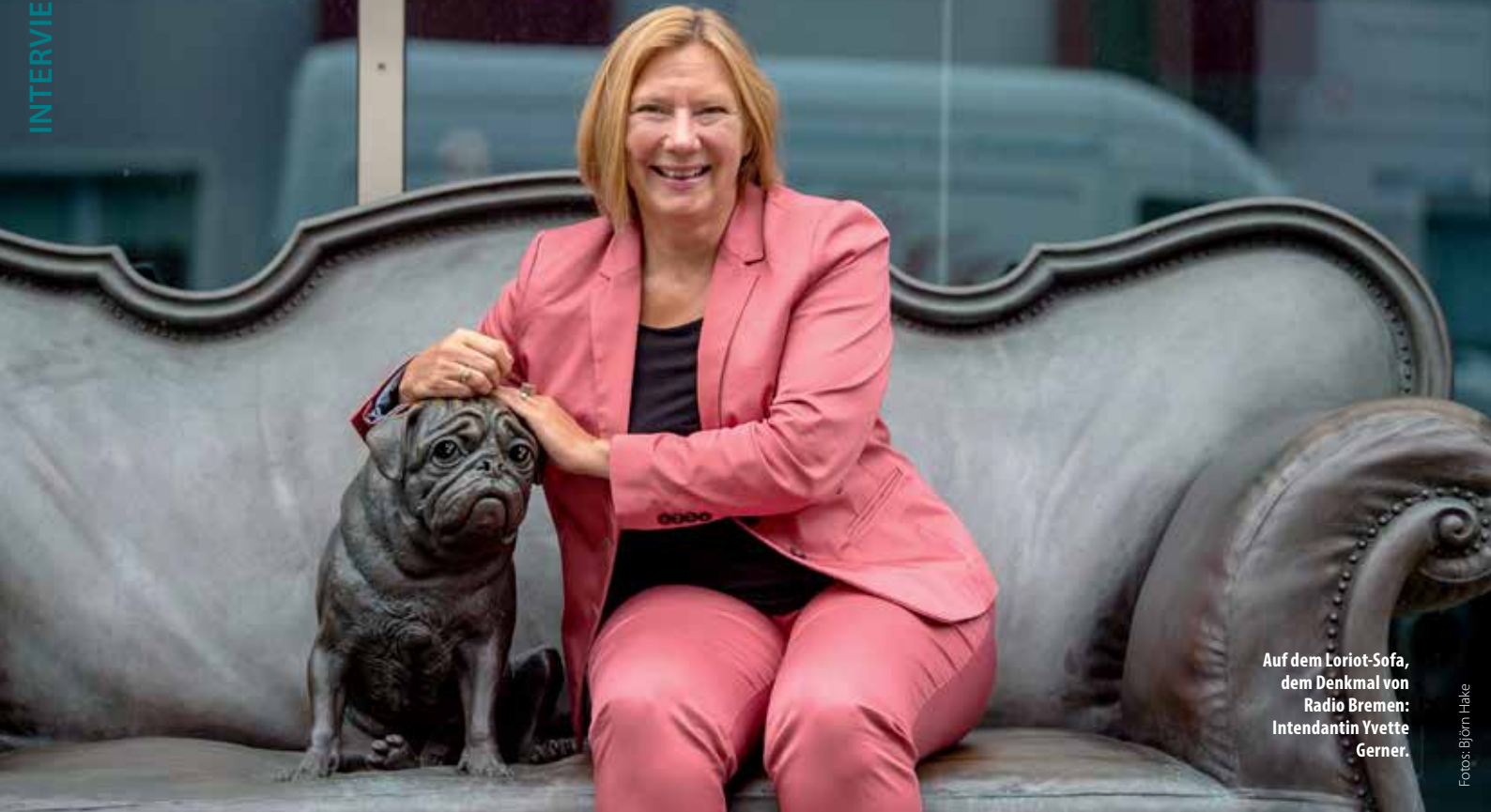
Auf dem Lorient-Sofa, dem Denkmal von Radio Bremen: Intendantin Yvette Gerner.