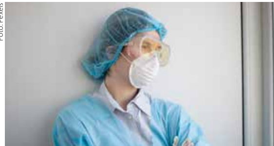
Wer im Krankenhaus fotografiert, muss auf die Sorgfaltspflicht achten – fürs Verpixeln ist allerdings die Redaktion zuständig.