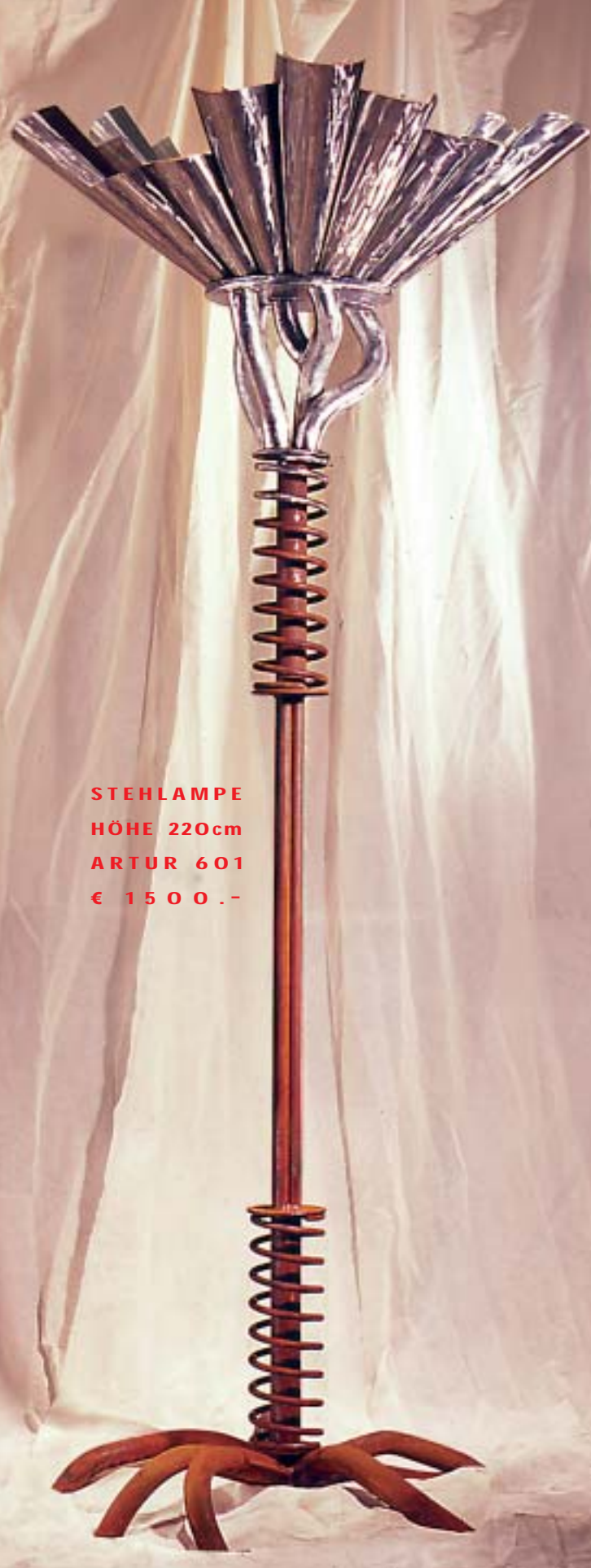
STEHLAMPE HÖHE 220cm ARTUR 601 € 1500.-