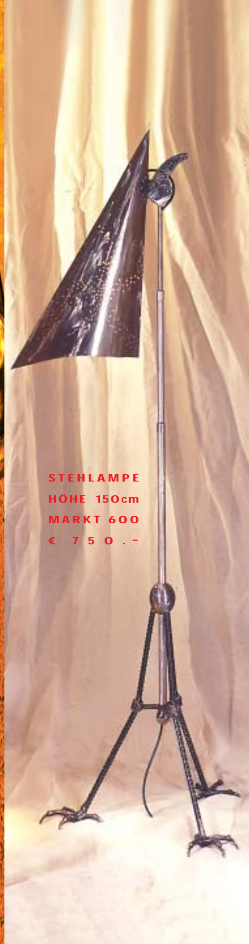
STEHLAMPE HÖHE 150cm MARKT 600 € 750.-