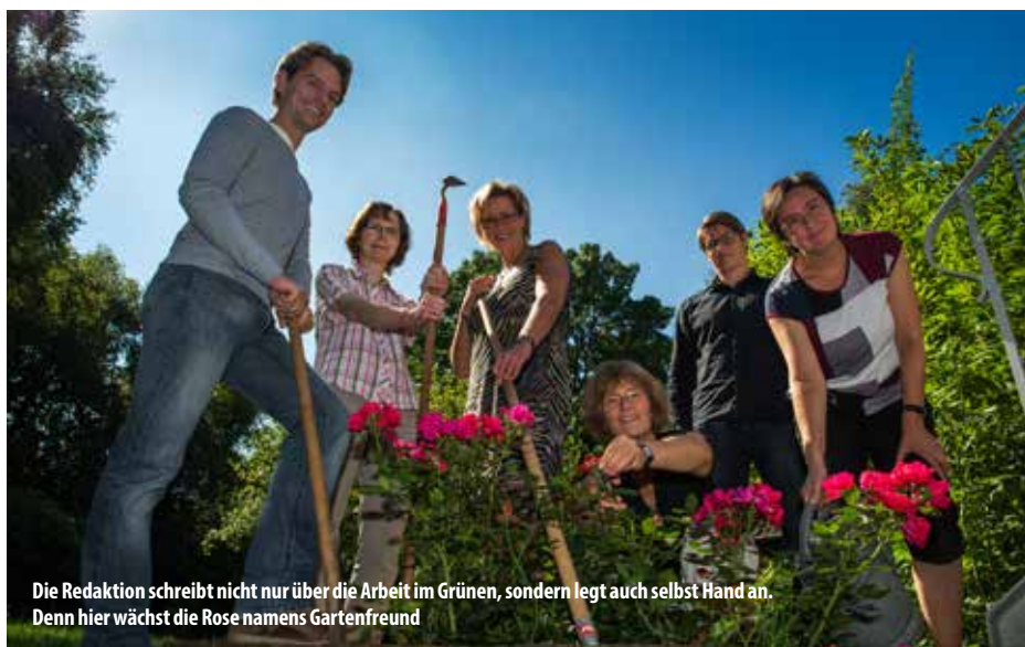
Die Redaktion schreibt nicht nur über die Arbeit im Grünen, sondern legt auch selbst Hand an. Denn hier wächst die Rose namens Gartenfreund

„Man kann so viele Themen bringen – ob es um Schmetterlinge in Not oder um Gartenwerkzeuge geht.“