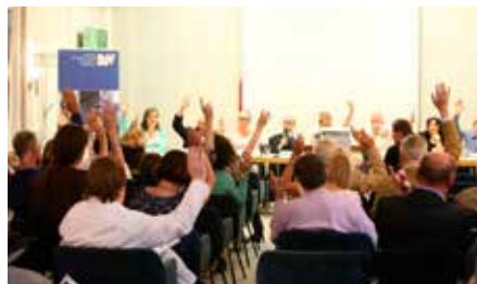
Einstimmig forderte das Plenum mit den Dringlichkeitsanträgen von den Verlagshäusern, ihrer sozialen Verantwortung gerecht zu werden