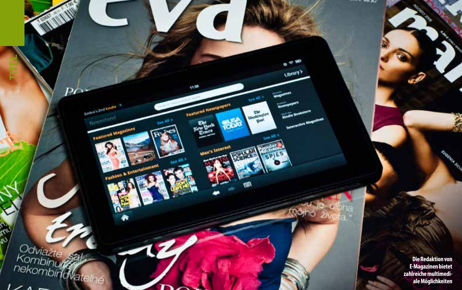
Die Redaktion von E-Magazinen bietet zahlreiche multimediale Möglichkeiten