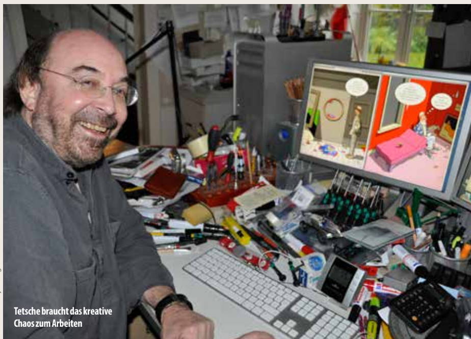
Tetsche braucht das kreative Chaos zum Arbeiten