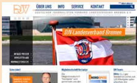
Startseite der neuen Bremer Website