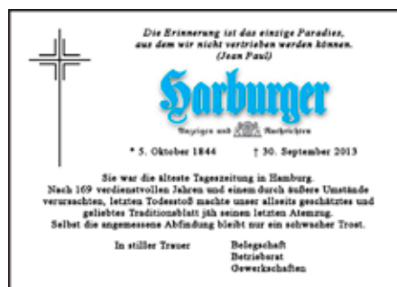
Collage: Rainer Miersmann

Darüber hinaus vereinbarten die Betriebsparteien die Einrichtung einer Transfergesellschaft mit einer Laufzeit von zwölf Monaten, die, von Ausnahmefällen abgesehen, am 1. Oktober beginnt. Der Arbeitgeber fördert hier mit einem Bildungszuschuss in Höhe von 5000 Euro und einer Gehaltsaufstockung. Zu Beginn der Verhandlungen hatte die Arbeitgeberseite ein Angebot unterbreitet, das lediglich Abfindungen zwischen 0,2 und 0,45 Gehältern pro Beschäftigungsjahr, gestaffelt nach Lebensalter, vorsah. Die letzte Ausgabe der Harburger Anzeigen und Nachrichten erschien nach 169 Jahren am 30. September. Für Reaktionen auf diese verlegerische Entscheidung hat der DJV eine Plattform eingerichtet, auf der sich u.a. der DJV-Bundesvorsitzende Michael Konken und verschiedene Politiker geäußert haben: https://www.facebook.com/HANretten.de . Der Verlag hatte noch im vergangenen Jahr schwarze Zahlen geschrieben. Die Gesellschaft bleibt auch nach Ende der verlegerischen Tätigkeiten bestehen und verwaltet ihre Beteiligungen und ihren Immobilienbesitz. Zu den Gesellschaftern zählen die Springer AG und die Verlagsgruppe Madsack.