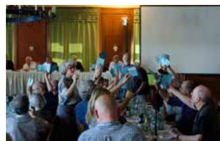
Bei der Mitgliederversammlung der VG Wort im September in München wurde keine Einigung erzielt