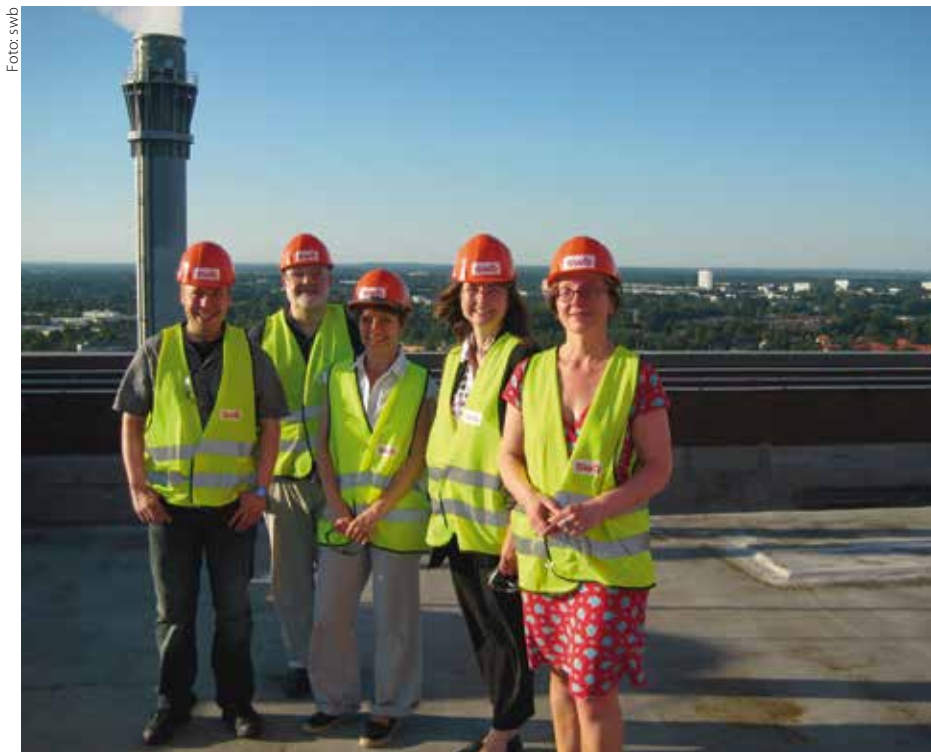
Legendär sind die Bremer Stammtische an ungewöhnlichen Orten, hier im Heizkraftwerk der Stadtwerke