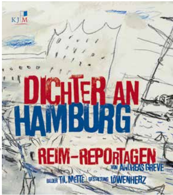
Cover: KJM Buchverlag

Gedichtet, gemalt und gestaltet präsentierte im Spiegelsaal des Museums für Kunst und Gewerbe ein ganz besonderes Trio im Sommer ein großes Buch zur eigenen Stadt mit dem Titel „Dichter an Hamburg“. Hamburg in Wort und Bild im wahren Sinne des Wortes.