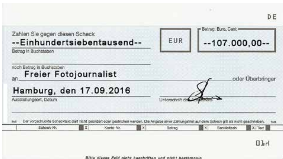
Fotojournalist erstreitet 107.000 Euro von Verlag

Der Kläger lieferte einer Tageszeitung seit dem Jahr 2000 regelmäßig Fotos. Schwerpunkt war dabei die Sportberichterstattung. Der Verlag zahlte pro Bild 10 Euro – unabhängig von Auflage und Größe der Veröffentlichung. Im Jahr 2010 wurden 1329 Aufnahmen des Klägers veröffentlicht, im Jahr 2011 waren es 1277 und im Folgejahr 891. Der Fotojournalist machte geltend, dass das gezahlte Honorar nicht angemessen im Sinne der Vorgaben des Urheberrechtsgesetzes (UrhG) gewesen sei. Er forderte gemäß Paragraph 32 UrhG eine Nachhonorierung. Hinsichtlich der Höhe stützte sich der Fotograf auf die Bildhonorare der gemeinsamen Vergütungsregeln für Tageszeitungen (GVR). Der Verlag hingegen vertrat unter anderem die Auffassung, dass die GVR nicht herangezogen werden könnten. Sie seien hinsichtlich der dort enthaltenen Bildhonorare erst 2013 in Kraft getreten. Darüber hinaus könne der Kläger auch keinen direkten Zahlungsanspruch geltend machen, sondern allenfalls eine Ver-