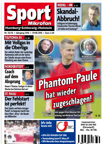
Cover: Sport Mikrofon